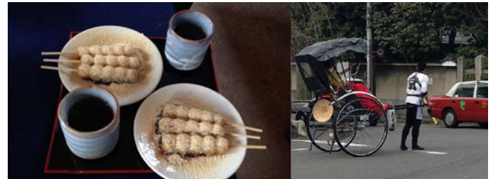
もう、これ以上の遠距離研修はできないと思われませんが、京都・何度でも行く人の気持ちが分ります。