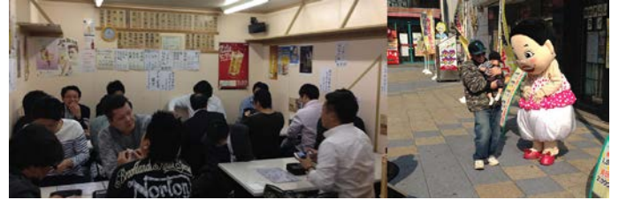
やっぱり、通天閣！ 大阪の風を感じる青年部員

日時：平成28年3月5～6日（土日） 場所：大阪～京都 「そうだ、京都に行こう。」のノリ？ではないですが、世界に誇れる日本の伝統文化！という事で、京都・大阪の研修となりました。大阪に到着。まずは串カツ！と、くるよ姉さんのお出迎えます。