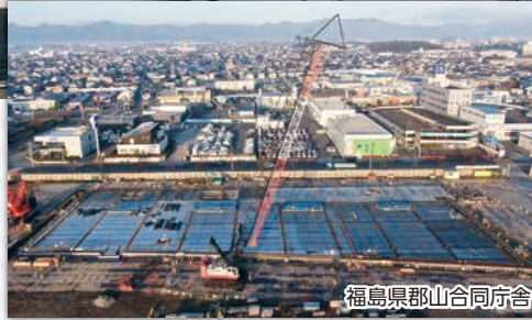
福島県郡山合同庁舎