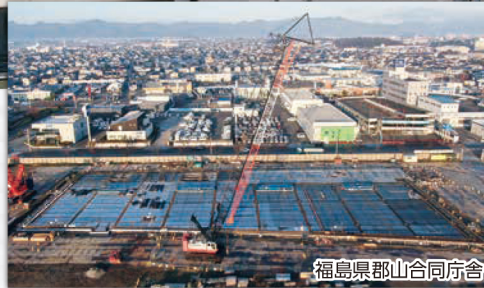
福島県郡山合同庁舎